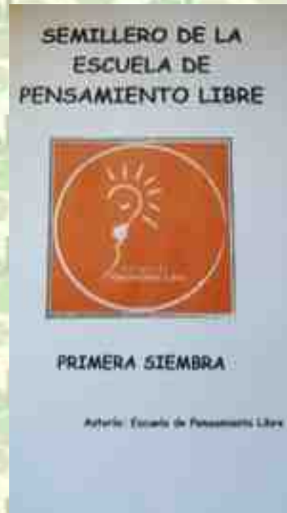
SEMILLERO DE DINÁMICAS