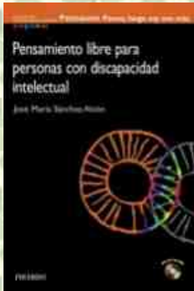
Diario de Ximo