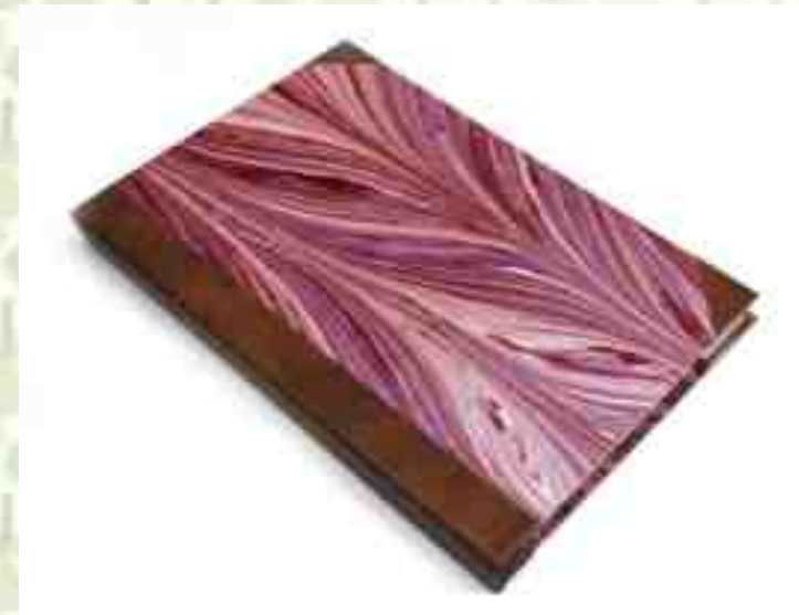
Diario de Pensamientos